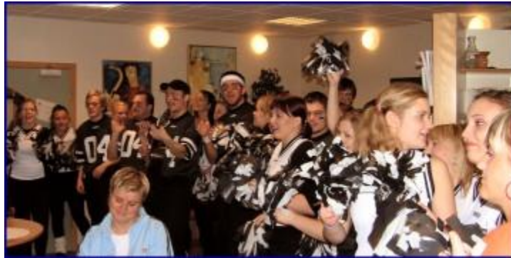
Útskriftarnemar syngja á kennarastofu í frímínútum.

Í dag halda útskriftarnemar dimission. Þeir buðu kennurum í morgunverð klukkan 7 í mötuneyti skólans. Klukkan 11:30 bjóða þeir nemendum og kennurum á skemmtidagskrá á sal skólans. Gleðskapnum lýkur svo með samkomu sem hefst klukkan 8 í kvöld þar sem kennurum skólans er boðið. Í kvöld heldur nemendafélagið einnig síðasta dansleik annarinnar. Hann fer fram á sal skólans og stendur til klukkan 2 eftir miðnætti.