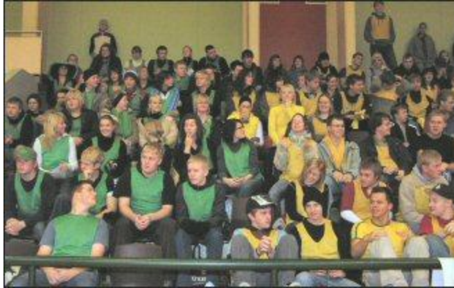
Fleiri myndir af skammhlaupinu eru hér.