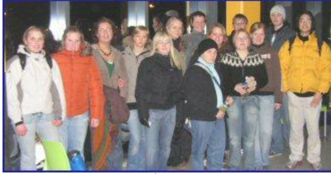
Nemendur í ÍPR3U1 í skautiferð

Flestir nemendur skólans taka einn íþróttaráfanga á hverri önn og til að koma til móts við ólíkar þarfir og áhuga er nú boðið upp á fjóra mismunandi áfanga eftir að nemendur hafa lokið fyrsta árs námsefninu í ÍPR102 og ÍPR202. Þetta er áfangarnir: