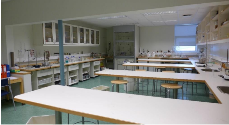
Mynd 3. Kennslustofa í raungreinum í FVA

Það kom fram hjá kennurum að námsefni væri misjafnt eftir námsgreinum frá því að vera eldgömul bók yfir í mjög gott efni. Nemendur bentu á að í sumum tilfellum væri námsefnið komið til ára sinna en þó væri töluvert af efni komið á rafrænt form, t.d. í formi talglæra og myndbanda. Mikið af námsefni í verknámi er á rafrænu formi í gegnum Ipad.