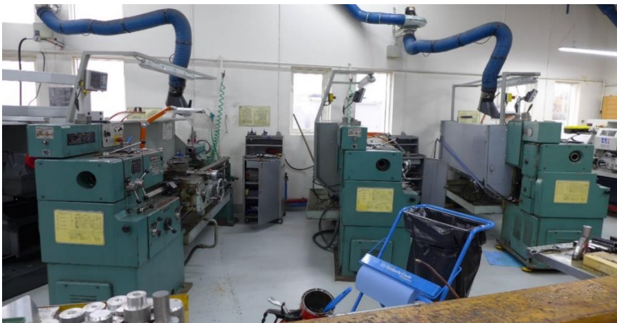
Mynd 4. Kennslustofa í málmiðn í FVA

Það kom fram hjá kennurum að námsefni væri misjafnt eftir námsgreinum frá því að vera eldgömul bók yfir í mjög gott efni. Nemendur bentu á að í sumum tilfellum væri námsefnið komið til ára sinna en þó væri töluvert af efni komið á rafrænt form, t.d. í formi talglæra og myndbanda. Mikið af námsefni í verknámi er á rafrænu formi í gegnum Ipad.