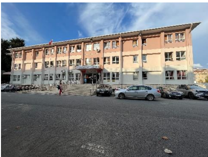
Mynd 5: Skólinn í Tyrklandi