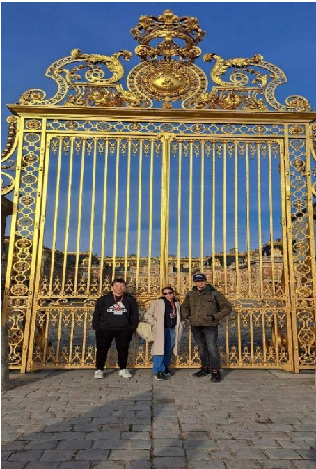
Mynd 9: Íslenskir nemendur fyrir utan Versali