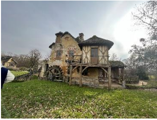
Mynd 8: Lítið hverfi þar sem dýr Marie antoinette voru