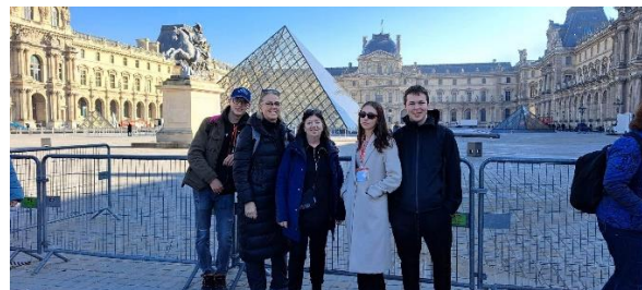
Mynd 6: Íslenska teymið úti í París

Önnur ferðin var til Parísar og áður en við byrjuðum á verkefnavinnu fengum við smá pásu til þess skoða okkur um og aðlagast umhverfinu ólíkt ferðinni til Istanbúl en fyrsta daginn var farið í góðan göngutúr um París og skoðað Bastilluminnisvarðann og Notre Dame kirkjuna. Svo var komið að því að hitta nemendur frá öðrum löndum og fórum við í Brétigny-sur-Orge hverfið sem er rétt fyrir utan París. Byrjað var á því að flytja kynningar líkt og áður og skólinn skoðaður. Svo hélt hópurinn inn í Parísarborg og allir fóru saman í siglingu á Signu. En á meðan á ferðinni stóð fórum við á marga áhugaverða staði að skoða eins og að Louvre-safninu, en við fórum að vísu ekki inn. En einnig sáum við Sigurbogann og fórum í Eiffelturninn. Við eyddum einum deginum á Versölum þar sem höllin, garðurinn og fleira var skoðað yfir daginn. Á föstudeginum sem var síðasti dagurinn okkar, átti einn af tyrknesku nemendunum afmæli og voru honum gefnar nokkrar gjafir og kaka í tilefni dagsins. Að lokum þurftum við svo að kveðja nýju vini okkar.