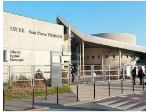
Mynd 7: Aðalbygging skólans í Frakklandi