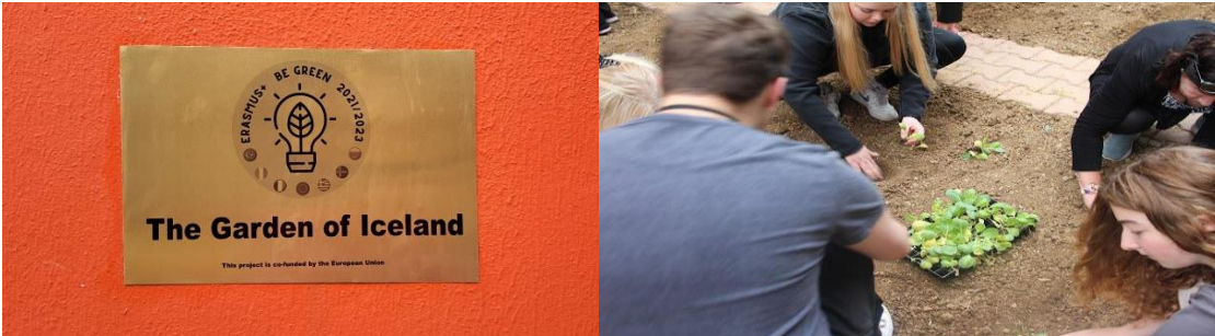
Mynd 4: Íslenska teymið að vinna hörðum höndum í gróðursetningu

milli heimsálfanna Evrópu og Asíu. Síðasta daginn gróðursettum við grænmeti í garði á bakvið skólann. Að lokum var komið að kveðjustund þar sem við kvöddum alla nýju vini okkar og snerum aftur til Íslands. Okkur fannst mjög gaman að fara til Istanbúl og þetta var alveg mjög einstök upplifun þar sem við kynntust nýju fólki á okkar aldri og munum við ekki gleyma þessu fljótt.