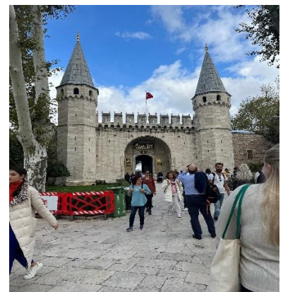
Mynd 2: Gömul höll Ottómanveldisins