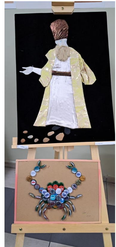
Mynd 1: Flott listaverk frá nemendum úr Tyrklandi úr endurundum efnunum

þreyttir eftir að hafa eytt 20 klukkutímum í að ferðast daginn áður og fengið aðeins 3ja klukkutíma svefn áður en við þurftum að mæta. Við fengum að heyra fyrirlestur frá prófessor úr háskóla í Istanbúl og flutti fyrir okkur mjög spennandi kynningu um plastmengun og áhrif þess á umhverfið. Eftir það fórum við að skoða endurvinnslustöð sem var með moltu og var farið með okkur í gegnum ferlið þar og okkur sýnd moldin og nokkrar plöntur sem höfðu vaxið í henni. Við skoðuðum líka garð með alls konar plöntum og fengum kynningu á hvað væri hægt að nota þær í. Einnig fengum við mjög skemmtilega leiksýningu sem tyrkneskir nemendur settu upp og átti að sýna afleiðingar þess ef menn fara ekki að hugsa betur um umhverfið. Seinna fengum við að skoða lítinn skóg sem var vaktaður og var svakalega flottur og vel búin að hugsa um þetta svæði. Það var rosalega skemmtilegt þegar við fórum að skoða sædýrasafn þar sem hægt var að sjá allt frá krókódílum að mörgæsum, eftir það lærðum við aðeins um sögu landsins og skoðuðum gamla höll frá tímum Ottómanveldisins. Eitt kvöldið var svo sigling upp Bosporussund sem liggur í gegnum Istanbúl og er landamæri