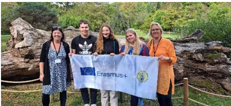
Mynd 3: Íslenska teymið í Istanbúl

Einnig töluðum við um umhverfismál í skólanum okkar, hvernig flokkunarkerfi við notum og hvernig skólinn okkar er umhverfisvænn, en einnig hvernig við getum bætt okkur. Hinir nemendurnir úr Tyrklandi, Frakklandi, Ítalíu og Búlgaríu fluttu einnig fyrir okkur áhugaverðar kynningar um skólann og landið þeirra.